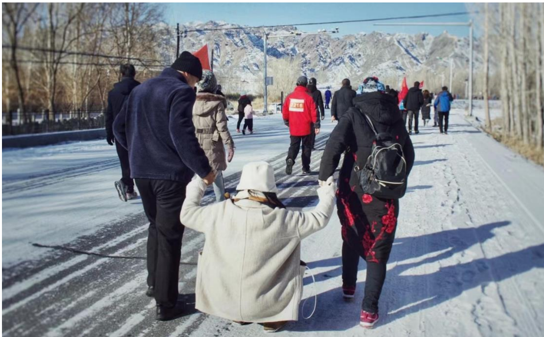
//2021年元旦，嘉峪关 - 在身后拍下叔叔阿姨拽着牛圆圆 在公路上的雪上滑行。

我也和刘思彤说过我从来没有想过/也无法和你的父母比什么或者替代叔叔阿姨等等。 你任何时候问我这世界上最爱你的人是谁，我都不会说自己，因为那一定是叔叔阿姨。 我希望的是可以帮叔叔阿姨分担照顾你的任务；让叔叔阿姨轻松一点。 可以把时间留给彼此，就像我把时间留给你一样。